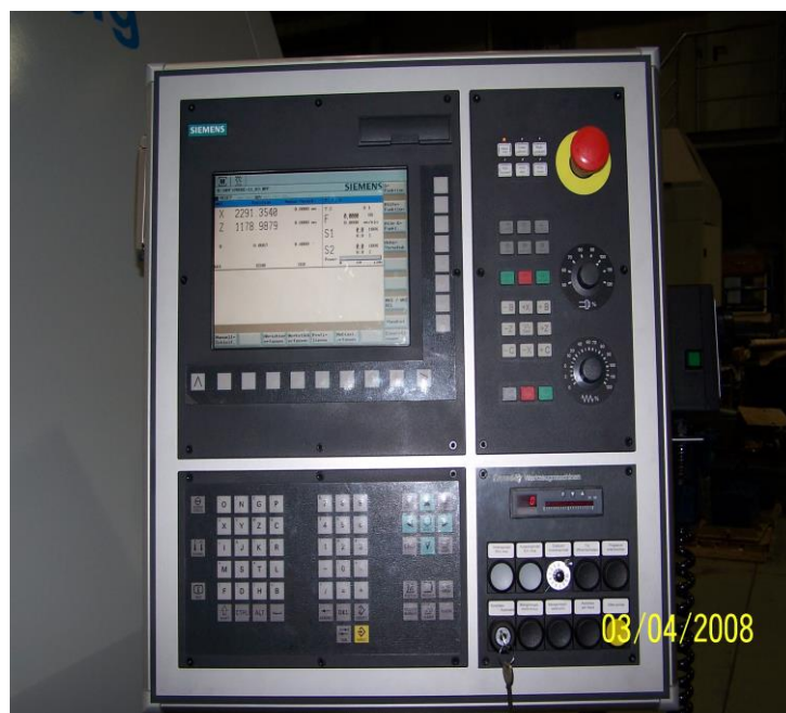
Bedientafel mit SIEMENS 802 D sl