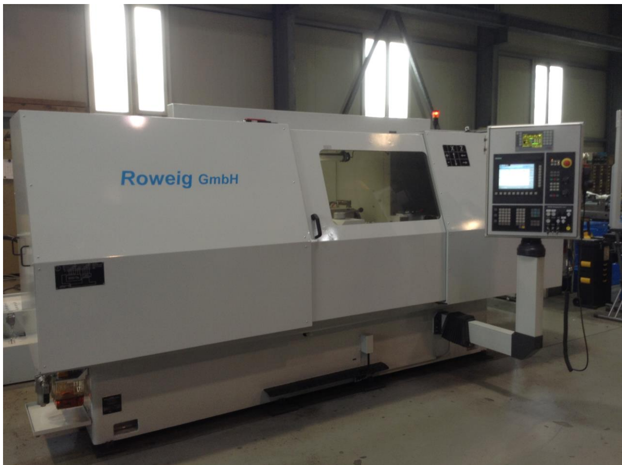
(Beispiel) SA 5/2 – CNC x 1000