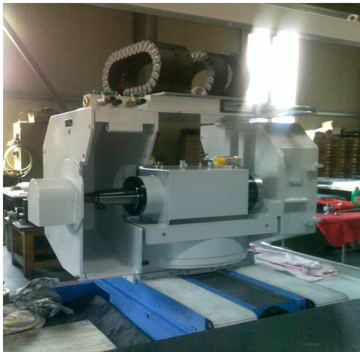
Drehteil mit Zustellachse (X)